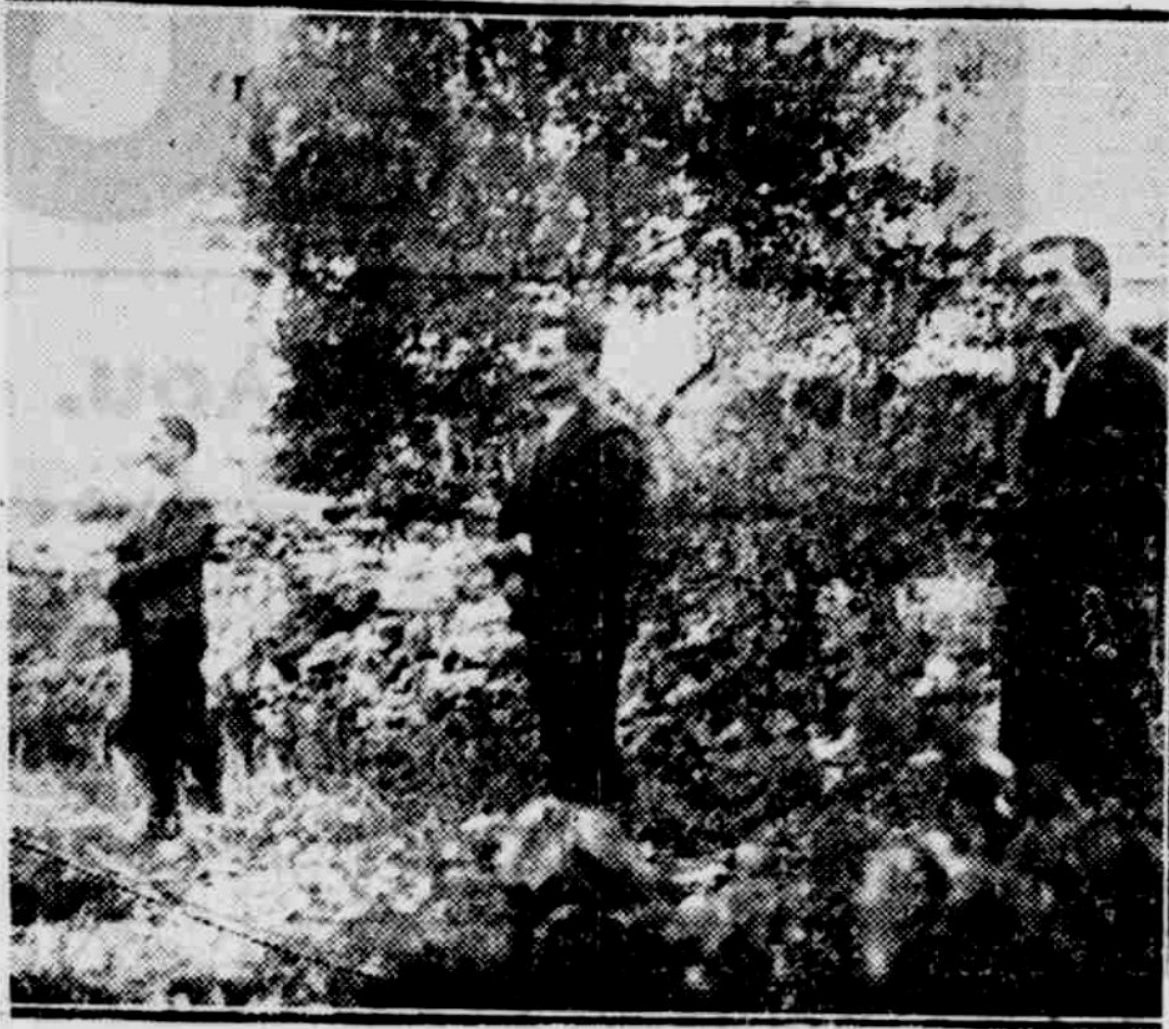
Ἀπὸ τὴν χθεσινὴν ἐκτέλεσιν τῶν τριῶν καταδίκων εἰς τὴν Αἴγινα. Ἡ φωτογραφία ἐλήφθη ὀλίγα δευτερόλεπτα πρὸ τοῦ τουφεκισμοῦ.