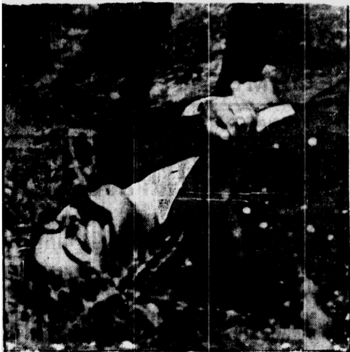
Ο ΣΩΤΗΡΧΑΙΝΑΣ , αρχηγός της «Καμέρας» που έτρεμοκράτησε την Αεθάδειαν, νεκρός.