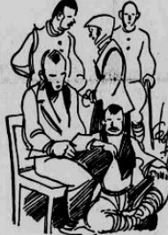
Καὶ τοῦ μένου ἀκόμη πέντε.

νεται κάπως ἐνδεκάτοια ὅταν ἡ ἐξοικιασθὴ βασίλειε στὸ σπίτι καὶ ἡ ἀποθήκη εἶνε γεμάτη ἀπὸ τὴν ἐσοδεία. Τότε θεοδαίως τὰ παιδιά, που τὰ μάγουλά τους στάζουν αἶ- μα, ἐρχονται γελαστά καὶ μᾶς προσφέρουν γιὰ τὸ ταξίδι τῆς ἐ-