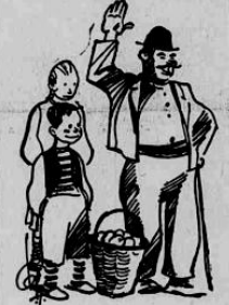
— Στὸ καλὸ καὶ νὰ σὰς ἐ- ναθούμε.

νες νὰ ἐκτελοῦν καὶ τὰ πειρὸ θα- ρεῖα καὶ ἀποκρουστικὰ καθήκοντα. Καὶ ὅλα αὐτὰ χωρὶς νὰ περὶ- μεν κομμιῶν ἀνταμοιβῆ, κανένα εὐχαριστή. Πολλὲς ἀπ' αὐτὰς ἐ- πλήρωσαν καὶ μὲ τὸ αἷμα τους τὴν ἀφοσίωσιν τους καὶ γνωρίζω ἐγὼ