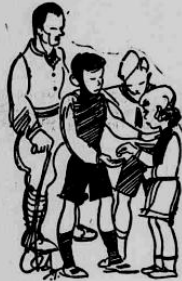
Στον πρόχειρο έσανο...

Μιά από τις μεγαλύτερες άρε- τες του ελληνικού λαού, που τον έκανε να κρατήσει ανέπαφο τον έ- θνισμό του, τη γλώσσα του, την θρησκεία του και τις παραδόσεις του μέσα σε τόσες θύελλες που του